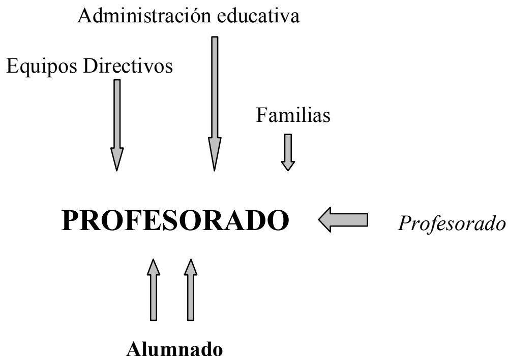
GRÁFICO 1. Bullying vertical ao profesorado