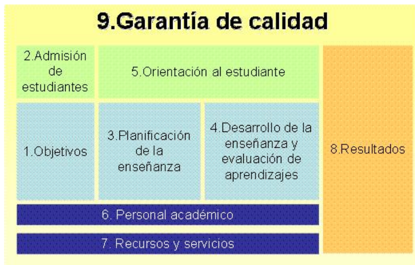
GRÁFICO II: ESQUEMA DE LOS CRITERIOS DE LA ACREDITACIÓN