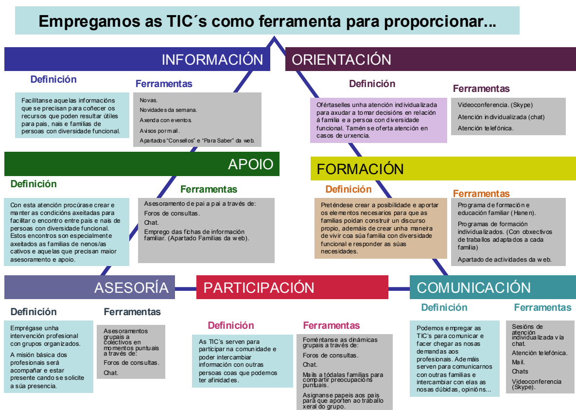
FFigura 1. Exemplo das posibilidades de emprego das TIC's no programa virtual de atención e intervención familiar.

A finalidade deste despregue de medios para atender as familias é facilitar que a persoa con diversidade funcional se desenvolva, por iso e tendo en conta que para todas as persoas é fundamental a contorna para acadar que crezan e se desenvolvan, preténdese traballar con tódalas contornas que propician o desenrolo das persoas con diversidade funcional (especialmente as contornas familiar, escolar, comunitaria). Dentro de todas elas resulta especialmente importante a familiar xa que grazas a ela se pode facilitar ou entorpecer enormemente o desenvolvemento propio e o que se dá noutras contornas. É con papá, mamá e os irmáns con quen normalmente as persoas adquiren as súas primeiras palabras, hábitos, rutinas... e é tamén grazas a eles cos que teñen pautas que lles axudan a relacionarse na escola, cos compañeiros, mestres e na comunidade en xeral aprendendo a ir de compras, respectar as quendas, saber que comportamentos son axeitados en público e cales non... Por iso resulta fundamental traballar coas familias e facerlles entender que o traballo que fagan cos seus cativos e cativas van facilitar o seu desenvolvemento e inclusión na sociedade. Por iso a familia debe saber como dar os apoios axeitados para que as persoas con diversidade funcional poidan desenvolverse, medrar e ter unha vida con calidade.