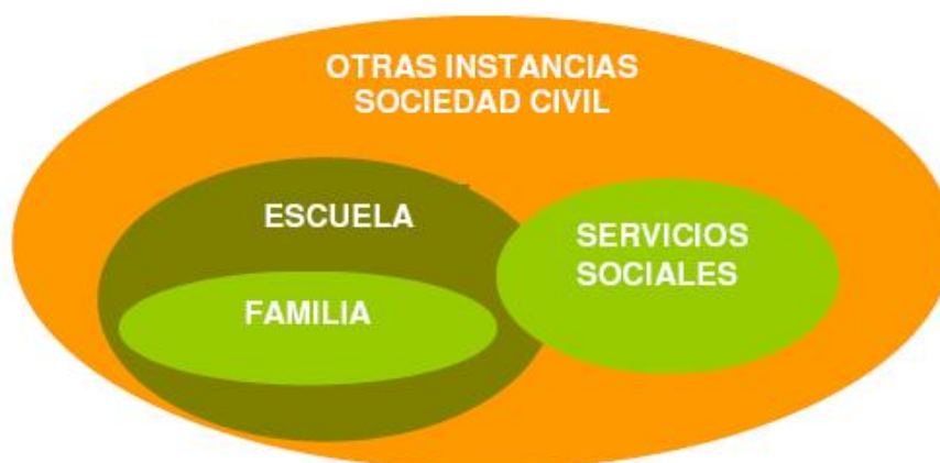
Figura 2: Axentes de intervención en cada centro

Na táboa que segue recolleemos a estrutura que sostén o desenvolvemento do programa en cada centro.