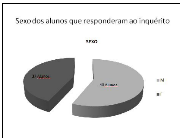
Figura 1 – Representação gráfica do número de inquiridos segundo o sexo.

Seguidamente, a título de exemplo, apresentamos o trabalho de um dos grupos, o Grupo 2, em que se estudaram os “Hábitos de consumo de café” de alunos dos Cursos Profissionais da sua Escola. Este grupo, no seu relatório, começa por referir a problemática do estudo efectuado e caracterizar a população implicada, recorrendo a um gráfico circular (envolvendo frequências absolutas) para concluir, do total dos inquiridos, quantos eram do sexo feminino e do sexo masculino (Figura 1).